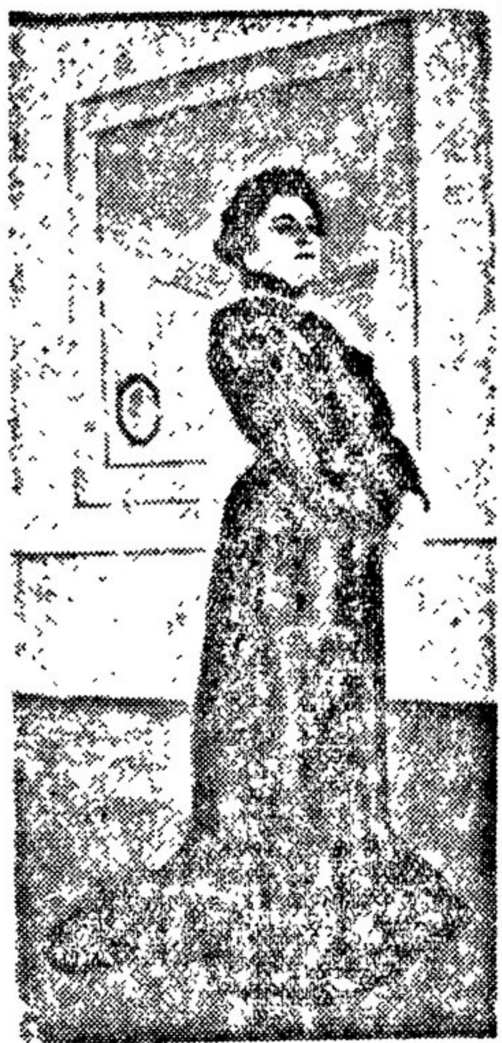
М. Н. Ермолова. Портрет работы В. Серова.