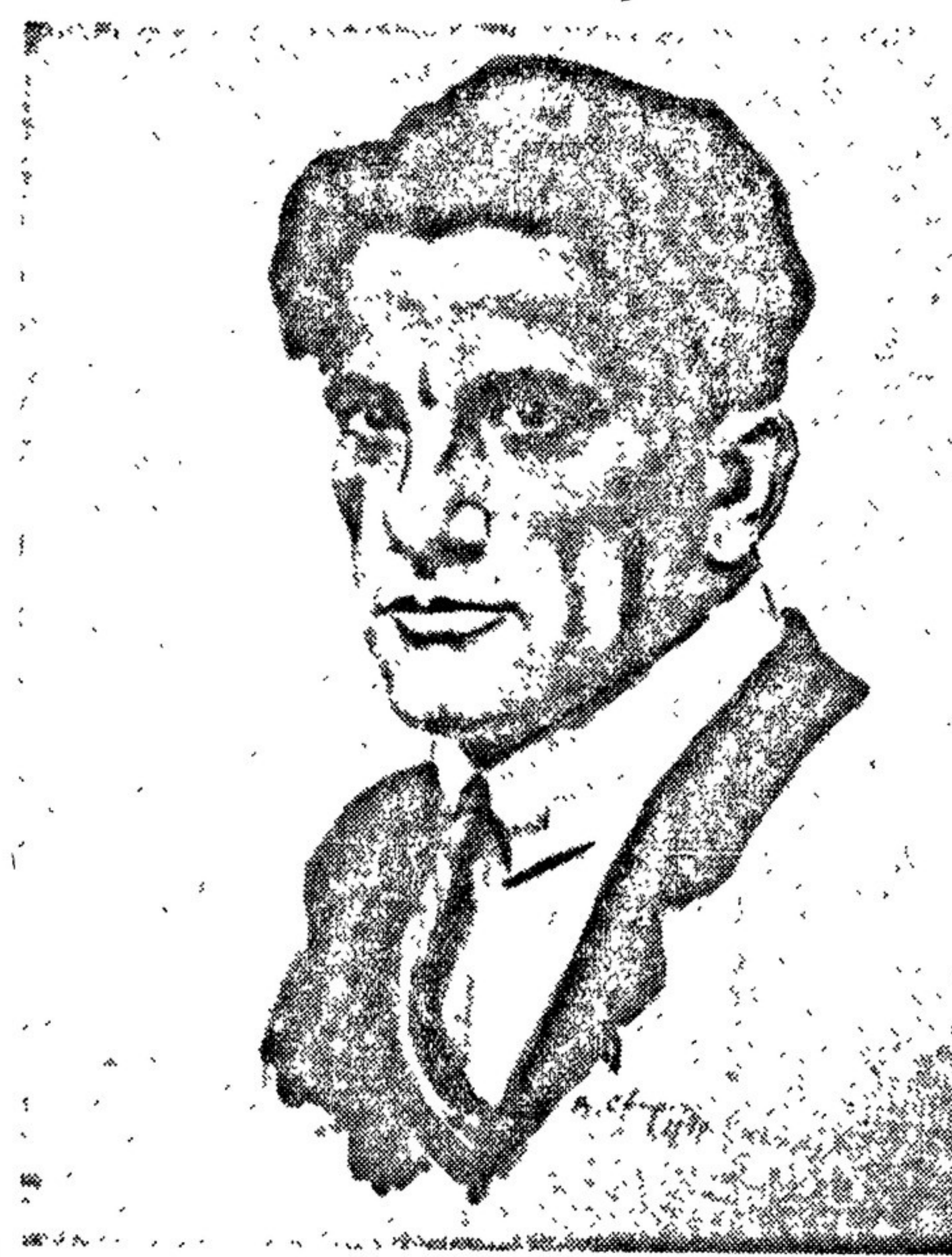
Маяковский Художник В. СВАРОГ. Тушь.

но подходить к работе в кино, считая ее по старинке делом второстепенным. Эти глубоко ошибочные взгляды приводят к тому, что из-под пера писателя рождается не столько шедевр, сколько аморфное, серое, оторванное от жизни, бессюжетное, лишённое ярких красок.